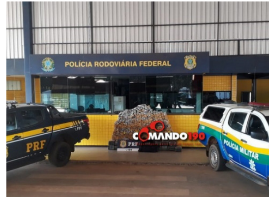
A maconha foi embarcada em Campo Grande (MS) e tinha como destino final a cidade de Vilhena