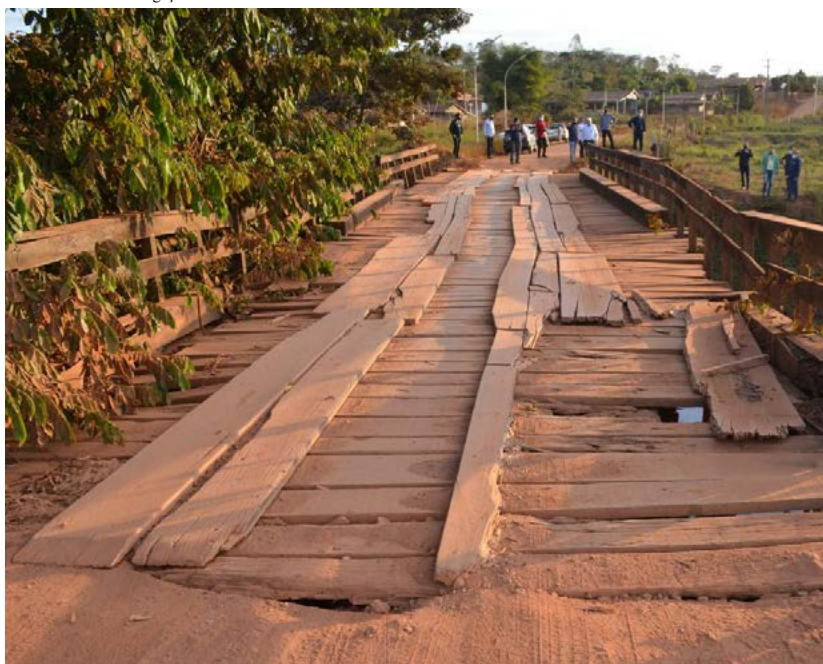
Ponte antiga estava com a estrutura comprometida e foi totalmente reconstruída pela equipe do DER

(Da Redação) O Governo de Rondônia, por meio do Departamento Estadual de Estradas de Rodagem e Transportes (DER), concluiu na terça-feira (4), a obra de reconstrução da ponte de madeira de 25 metros de extensão sobre o rio "Ararinha" na RO-495, no acesso à cidade de Parecis.