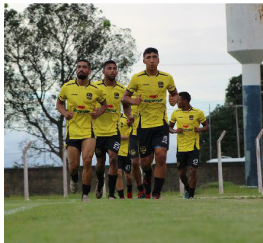
Equipe de Vilhena estava invicta, desde 3 de fevereiro de 2019