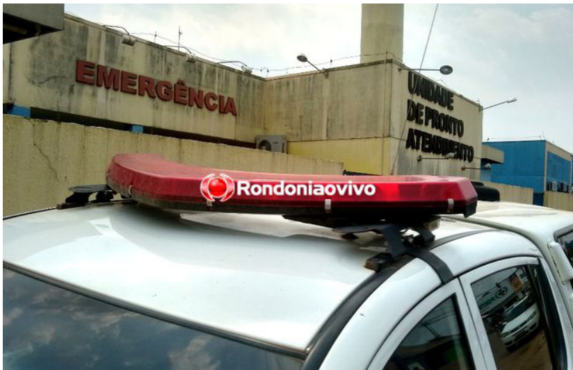
A criança foi levada ao pronto-socorro, mas já estava morta ao dar entrada na unidade

Um crime chocou a população rondoniense, na sexta-feira (13), em uma residência localizada na rua Geraldo Pataxó, bairro Lagoinha, região leste de Porto Velho. Uma bebê de oito meses morreu ao ter as partes íntimas dilaceradas por um criminoso ainda não identificado.