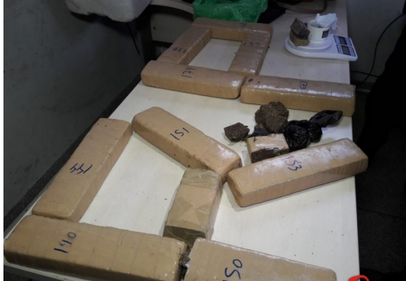
Na primeira abordagem a uma das suspeitas, os PM's encontraram cinco tabletes de maconha

Ao ser abordada no local, foram encontrados cinco tabletes de maconha. Questionada pela polícia, V.R.O.