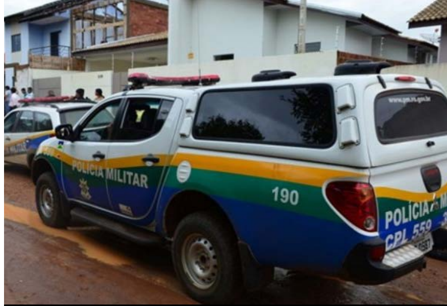
De posse das informações a guarnição da PM deslocou-se ao local do fato