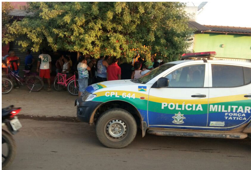
A Polícia Militar foi acionada e horas depois prendeu um dos suspeitos do crime