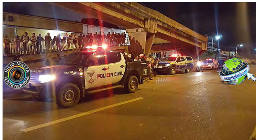
Ao reagir a assalto, policial militar atira, mata um e deixa outro ferido