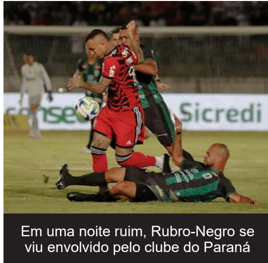
Em uma noite ruim, Rubro-Negro se viu envolvido pelo clube do Paraná

A partida de volta entre Flamengo e Maringá, no Maracanã, é no dia 26. O time paranaense tem a vantagem e poderá perder o jogo por até um gol de diferença que ainda avançará às oitavas de final. Para não depender dos pênaltis, o Rubro-Negro precisará vencer por três ou mais gols de diferença. Pressionado por mais um resultado frustrante e desempenho ruim, o Flamengo estreia no