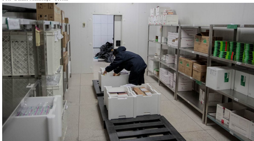
Cinco equipes formadas por técnicos da Agevisa e das regionais de saúde foram selecionadas para fazer a vistoria