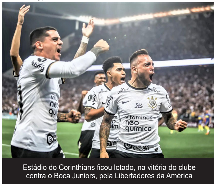
Estádio do Corinthians ficou lotado, na vitória do clube contra o Boca Juniors, pela Libertadores da América

abril, eram 40 mil em novembro de 2021. Em dois jogos como mandante no Brasileirão (derrota