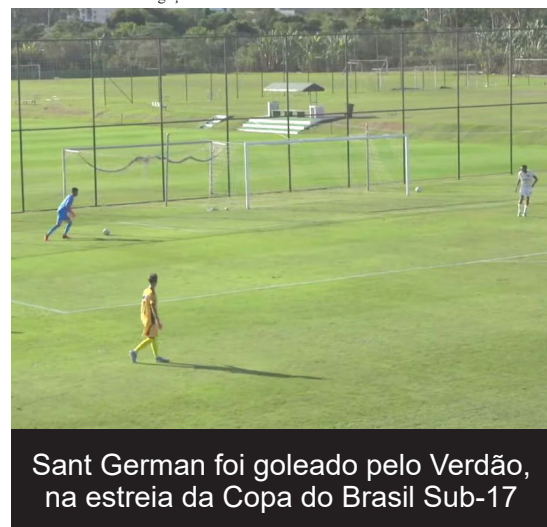
Sant German foi goleado pelo Verdão, na estreia da Copa do Brasil Sub-17

até a final são mata-mata com partidas de ida e volta, exceto nesta primeira fase. Não há o critério do gol qualificado e, em caso de empate, a disputa da vaga será nos pênaltis.