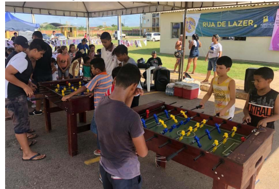
Projeto Rua de Lazer antes da pandemia

duas edições mensais para levar mais entretenimento, esporte e qualidade de vida aos moradores”, disse.