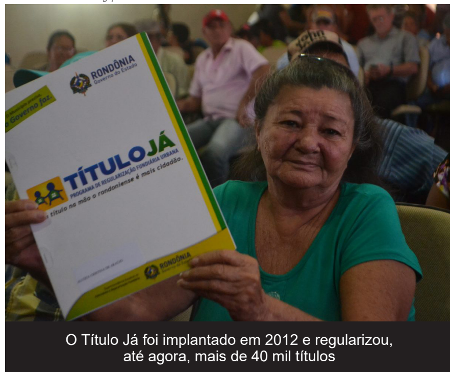
O Título Já foi implantado em 2012 e regularizou, até agora, mais de 40 mil títulos

De acordo com a gerente da Sepat, o programa Título Já, implantado em 2012 pela lei estadual nº 2910/12, já atendeu até agora 41.792 famílias carentes nos municípios de Alvorada do Oeste, Ariquemes, Buritis, Cacoal, Governador Jorge Teixeira, Ji-Paraná, Jaru, Pimenta Bueno, Presidente Médici, Primavera de Rondônia, Rolim de Moura, São Felipe do Oeste, São Francisco do Guaporé e Theobroma, onde o Governo do Estado investiu R$ 4,2 milhões em regularização fundiária urbana, possibilitando a essas famílias a garantia legal do direito de propriedade, com a