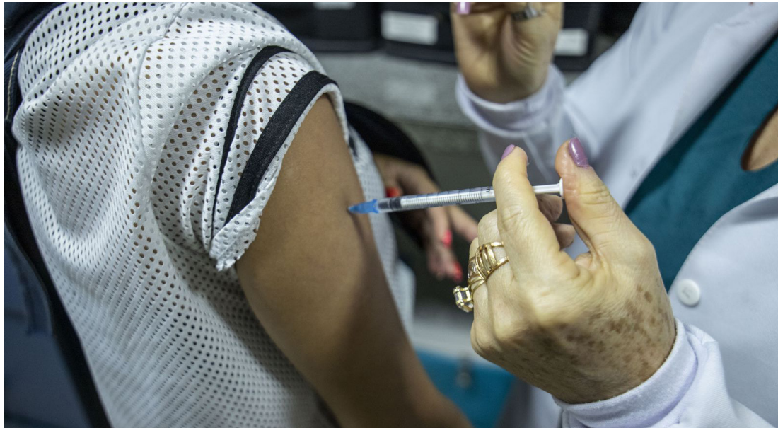
A vacina da gripe e as demais contra a Covid-19 estão disponíveis em todas as unidades de saúde

(Redação) Desde o final do mês de março, a vacina bivalente está disponível para pessoas a partir de 12 anos. A Prefeitura de Porto Velho, por meio da Secretaria Municipal de Saúde (Semusa), ampliou o público-alvo com objetivo de melhorar a cobertura vacinal.