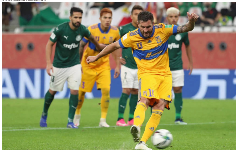
De pênalti, o atacante Gignac marcou o gol que eliminou o Verdão e levou o time mexicano à final da competição

González. O francês Gignac cobrou a penalidade e abriu o placar no Estádio Cidade da Educação.