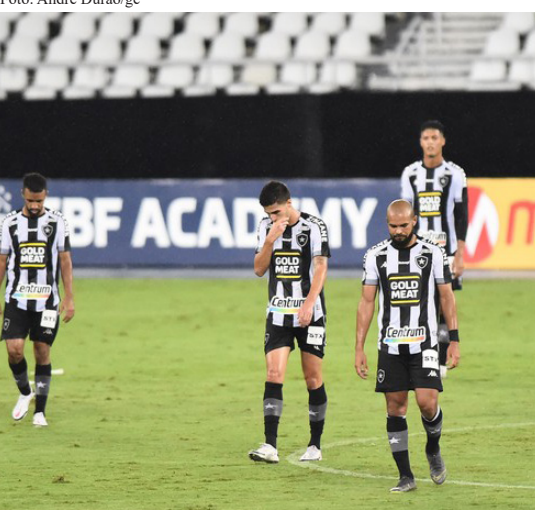
Jogadores lamentam a derrota para o Sport Recife, por 1 a 0, no Engenhão

(Marco A. Bernardi) O Botafogo perdeu para o Sport Recife, por 1 a 0, no Estádio Milton Santos (Engenhão), e é