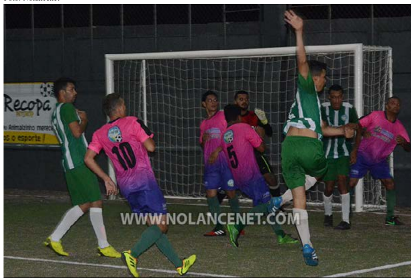
Em noite de pouca inspiração e alguns desfalques, a Curitiba Calçados foi derrotada pelo Localiza/Uniprov

primeiros instantes, o Onda Ágil abriu o placar e ampliou para garantir uma importante vitória. O jogo terminou com o placar de Príncipes das Capinhas/Atlântico 1 x 4 Social/Onda Ágil.