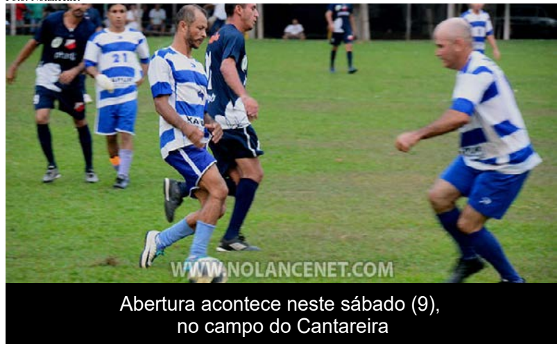
Abertura acontece neste sábado (9), no campo do Cantareira

(Chico Limeira) Tendo a confirmação de cinco equipes, começa neste fim de semana as disputas do 66º Campeonato Trintão de futebol de campo, de Ji-Paraná. A par-