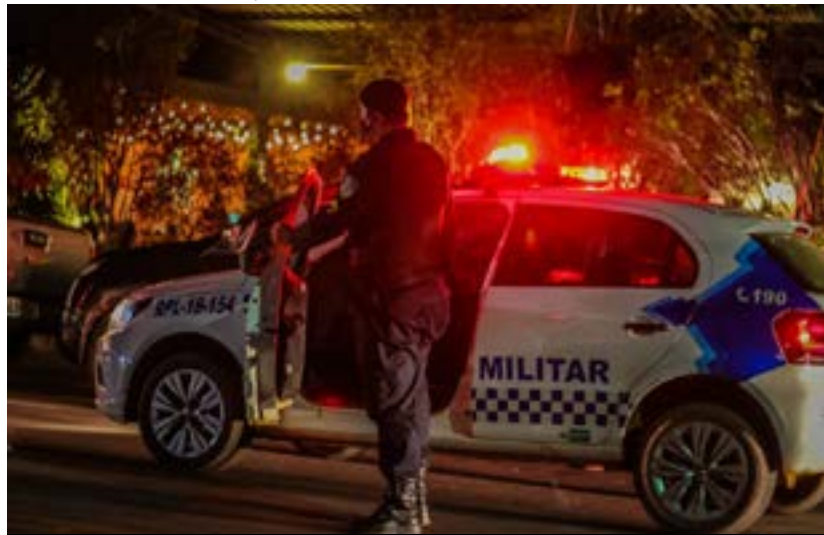
Patrulhamento ostensivo será reforçado durante o final deste ano para coibir prática criminosa em todo Estado

(Da Redação) Com a chegada do final do ano, onde ocorrem as tradicionais festas natalinas e de réveillon, a Polícia Militar de Rondônia (PMRO) começa a preparar estratégias para executar ações preventivas, reforçando seu efetivo operacional para garantir o patrulhamento ostensivo em Porto Velho e no interior do Estado, visando manter a segurança da população.