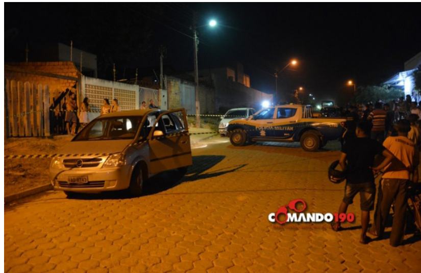
A Polícia Militar foi acionada e resguardou o local do crime a até a chegada da perícia técnica

Na noite de terça-feira (25), em menos de 48 horas, a Polícia Militar registrou mais um homicídio na cidade de Ji-Paraná. Desta vez, a vítima foi um pedreiro de 41 anos, identificado como G.A.