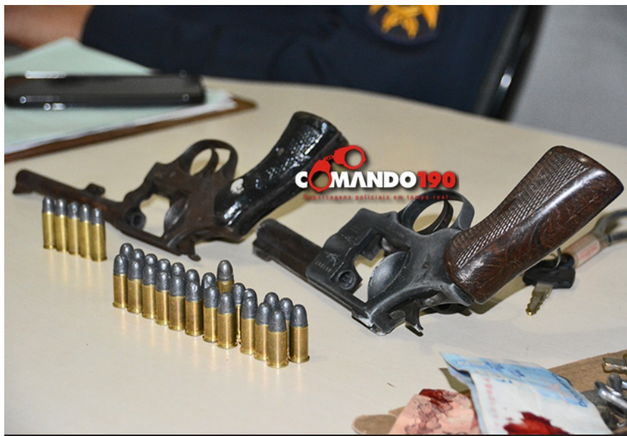
Com a dupla, os PM's localizaram as duas armas usadas no crime e muita munição